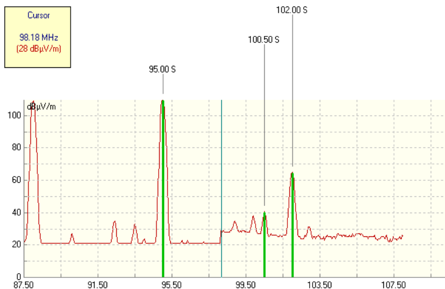
Mynd 2: Niðurstöður mælinga frá júní 2012

PFS framkvæmdi á ný mælingar við umræddan sendi þann 7. júní 2012. Niðurstöður þeirra mælinga sýna greinilega hækkun styrks fyrir hlutaðeigandi tíðnir RÚV frá fyrri mælingu og mældist styrkur sendis töluvert yfir 100 dB \mu V/m auk þess sem fram kom hækkun í svo kölluðu suðgólfi, en það er við 98,2 MHz, sbr. mynd 2. Suðgólf (e. Noise floor) er summa óæskilegra merkja. Á myndinni hækkar suðgólfið úr 21 dB \mu V/m í 28 dB \mu V/m við 98,2 MHz. Það veldur því að veik FM merki á þessu tíðnibili nást síður þar sem þau ná ekki nægjanlega upp úr suðgólfinu. Þetta er hins vegar ekki óeðlilegt og sem dæmi má nefna að suðugólf í Reykjavík er um 35 dB \mu V/m í samskonar mælingum sem jafnframt veldur að FM merki undir 35 dB \mu V/m nást sumstaðar ekki í Reykjavík.