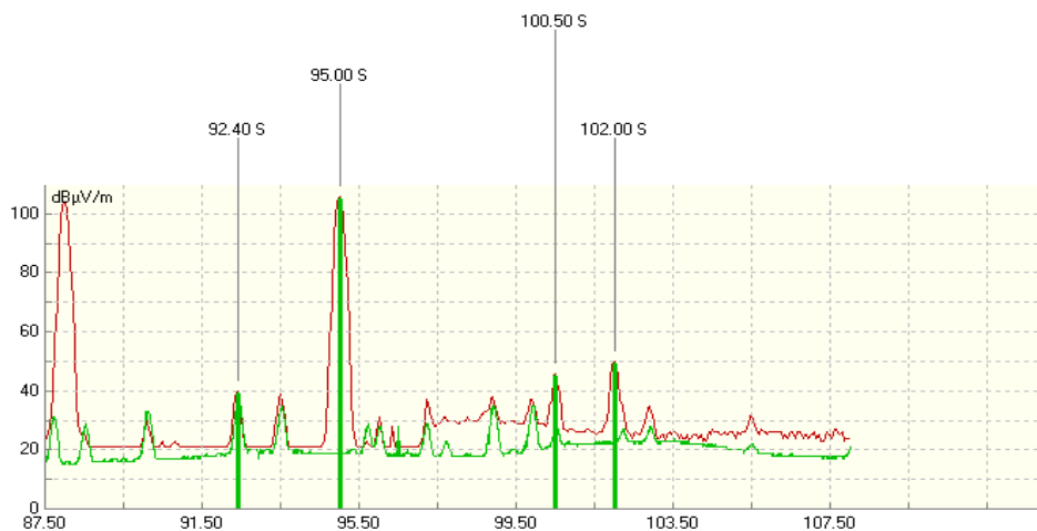
Mynd 3: Samanburður á mælingum frá október 2011 og júní 2012