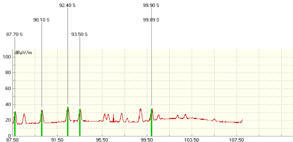
Mynd 1: Niðurstöður mælinga frá október 2011

Áður en PFS barst kvörtun sú sem mál þetta lýtur að höfðu starfsmenn PFS framkvæmt mælingar á útvarpssendingum í Sandgerði í október 2011. Hvað varðar RÚV náðust nokkur merki félagsins, þ.e. á tíðnunum 94,2 MHz frá Skálafelli (Rás 1), 99,9 MHz frá Skálafelli (Rás 2), 93,5 MHz frá Vatnsenda (Rás 1) og 90,1 MHz frá Vatnsenda (Rás 2). Við mælingarnar kom í ljós að merki útvarpssendinga reyndust almennt veik, þ.e. á bilinu 27-37 dB \mu V/m við Bjarmalandsveg og 25-35 dB \mu V/m við Suðurgötu en ekki var mældur meðaltalsstyrkur í bænum, sbr. mynd 1.